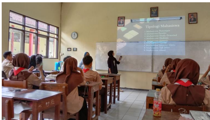
Gambar 3: Pemateri 3

Ini adalah donatur kampus, mahasiswa yang paling betah di kampus. Mahasiswa yang belum juga lulus di atas sepuluh semester atau lima tahun masa pembelajaran.