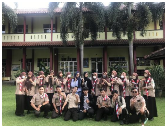
Gambar 6: Foto Bersama Audience Sosialisasi Pengenalan Dunia Kampus