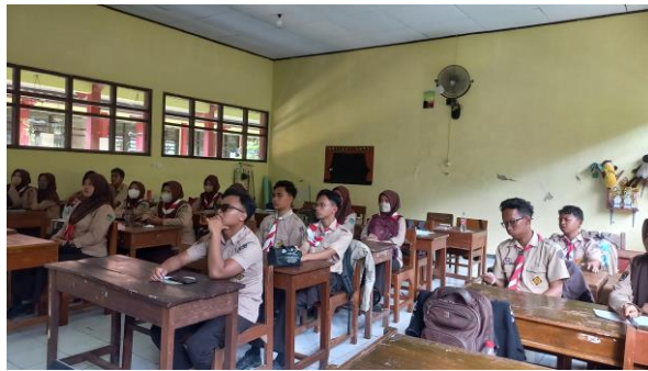
Gambar 4: Audience Sosialisasi Pengenalan Dunia Kampus