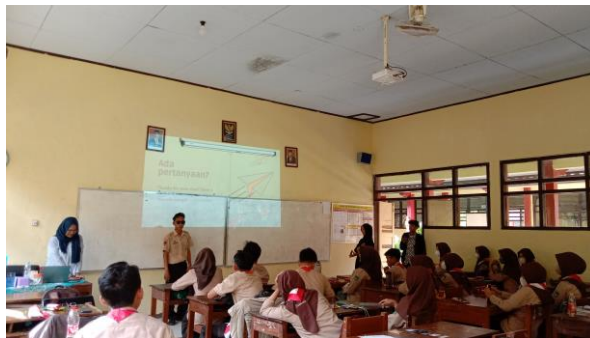
Gambar 5: Salah Satu Audience Menjawab Pertanyaan dalam Sosialisasi Pengenalan Dunia Kampus