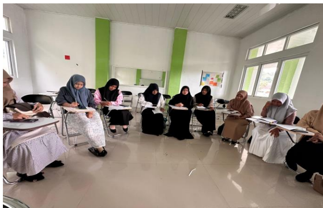
Gambar 1. Dokumentasi kegiatan pelatihan

bahwa mahasiswa mampu mengadaptasi cerita dengan cara yang tidak hanya akurat secara linguistik, tetapi juga mempertahankan nuansa budaya yang terkandung dalam cerita rakyat.