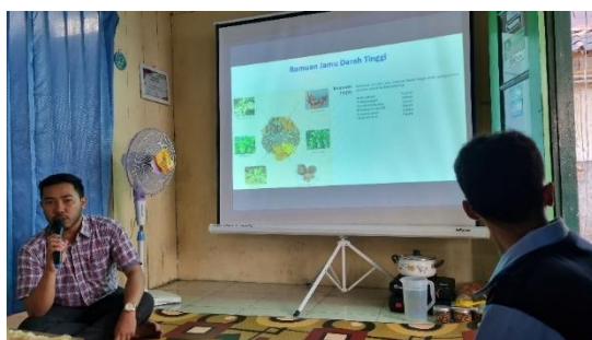
Gambar 2. Pemaparan Materi Komposisi Racikan Obat Herbal