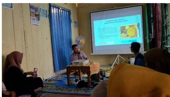
Gambar 1. Pemaparan Teori Khasiat Obat Herbal

penyerapan lemak di usus, sehingga apabila digunakan sesuai anjuran dapat memperlancar buang air besar. Penggunaan ramuan ini secara berlebihan / tidak sesuai dengan takaran dapat menimbulkan rasa mual, mulas, dan diare. Ramuan jamu diminum setengah jam sebelum makan. Bila setelah satu minggu pemakaian tidak ada perubahan atau semakin parah, dapat konsultasi ke dokter