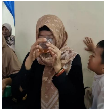
Gambar 3. Pembagian Sampel Jamu

Kemudian setelah melakukan praktek bersama membuat ramuan jamu untuk kebugaran beberapa ibu PKK mencoba sampel jamu untuk dinikmati bersama-sama.