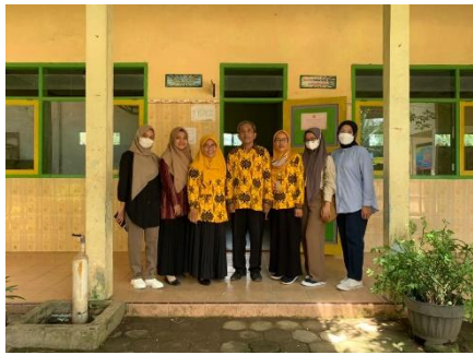
Gambar 3: Tim foto bersama dengan pihak sekolah