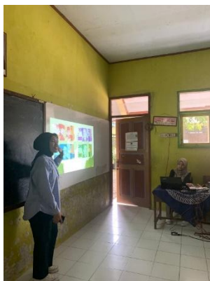
Gambar 1: Tim Memberikan Materi dalam Pelatihan Menabung

Tahap Selanjutnya, kami memaparkan penjelasan materi mengenai menabung, pada materi ini siswa-siswi kelas 4 diberikan penjelasan tentang perlu dan pentingnya menabung. Dengan menyampaikan materi ini kami harapkan siswa-siswi mengetahui tentang manfaat dari menabung, dan bisa memotivasi mereka untuk mulai menabung.