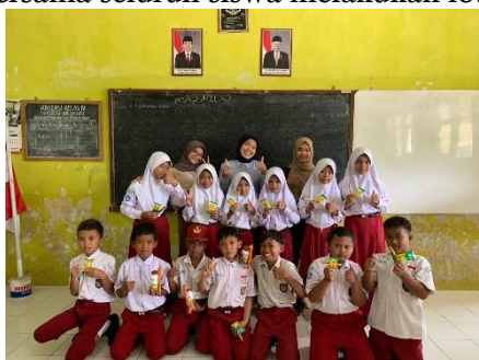
Gambar 2: Tim memberikan jajan kepada siswa

Setelah sesi pembahasan materi, selanjutnya adalah membagikan jajan kepada seluruh siswa-siswi. Pada sesi pembagian ini, semua siswa terlihat gembira dan sangat senang saat menerima satu persatu. Kebahagiaan anak-anak menerima ini merupakan salah satu kebahagiaan kami karena bisa berbagi kepada sesama terutama siswa-siswi SD Negeri Karang Sari. Kemudian kami bersama seluruh siswa melakukan foto bersama sebelum menutup kegiatan.